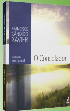
O Consolador. Q 313- Emmanuel

Somente aos pobres de espírito está destinado o Reino dos Céus ou Reino de Deus porque, “[...] em se dirigindo à massa popular, aludia o Senhor aos corações despretensiosos e humildes, aptos a lhe seguirem os ensinamentos , sem determinadas preocupações rasteiras da existência.”